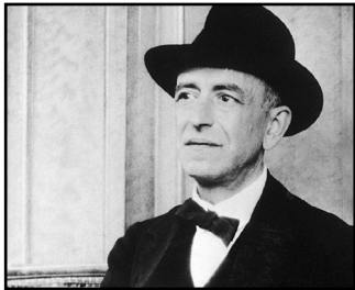
Manuel de Falla (1876-1946)

Allegro Allegro quasi andantino Largo - Molto presto