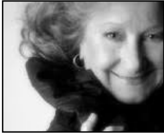
Ángeles López Artiga (1939) Electra. Ensayo nº 2 *